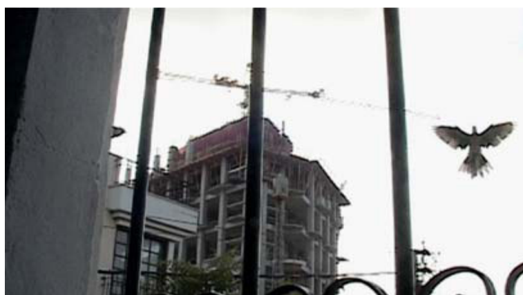
צילום 7: ענת אבן, "אחרי הסוף" (2009), צילום סטילס מתוך הסרט

המבט. המרחבים שנצפו מבעד למצלמת הטלוויזיה במעגל סגור הם מרחבים מתוחמים, מקוטעים, שנוצרו על ידי פלישה, עיקול וקיפוח. המצלמה מראה יהודים וערבים הגרים זה לצד זה בעוינות ובשנאה מוחלטת, כלואים בכתיים מאחורי שערים, חומות ומצלמות מעקב.